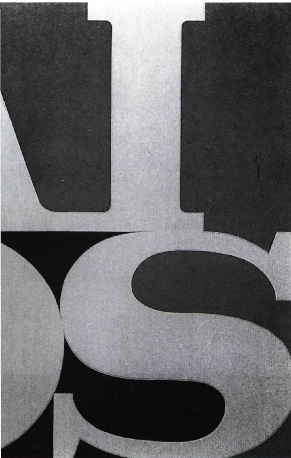
General Idea, AIDS, 1987. Sérigraphie sur papier, 76,2 x 76,2 cm. General Idea, Koury Wingate Gallery, New-York.

Idea s'inscrit alors tout à fait dans cette tradition d'éprouver les limites de sa discipline artistique, une petite touche d'humour en plus. Le travail sur le motif du color test pattern du médium télé en témoigne. Et ceci, tout en revendiquant bien sûr une distance critique plutôt incisive à propos de ce même monde des arts, de ses vanités et de ses représentations diverses à travers les médias. Mais General Idea, comme l'exposition au Musée des beaux-arts du Canada a