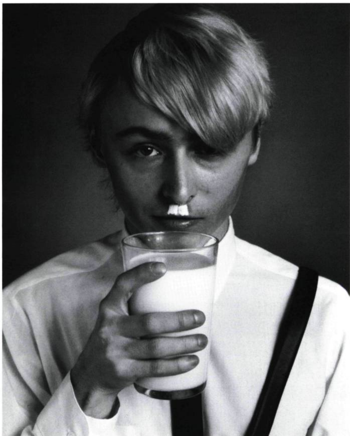
General Idea, Nazi Milk (détail de l'installation The Colour Bar Lounge ), 1979. Photographie, aluminium, verre et texte. Galerie Lucio Amelio, Naples.

joue justement sur la zone floue qui sépare contenu et contexte. Le médium est le message, disait McLuhan; General Idea trouve une nouvelle manière de donner du relief à cette proposition.