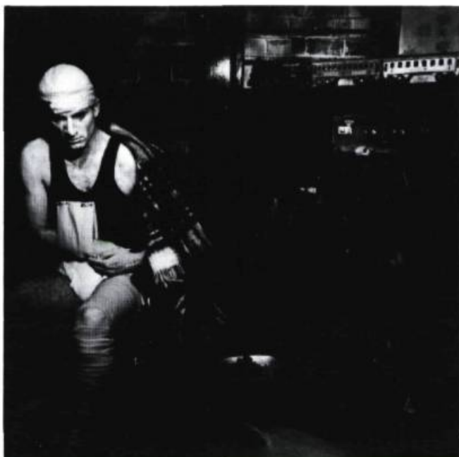
Farrel & Perkins, Sans titre # 6 , 1991. Extrait de A Passion for Maladies . Photographie couleur; 240 x 240 cm.