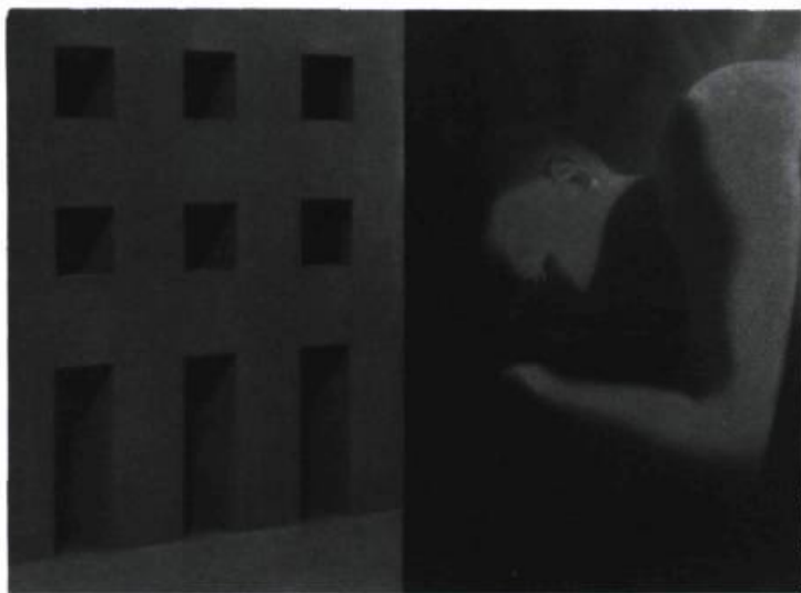
Fabrizio Perozzi, Philosophe IV , 1991. Huile sur toile de lin ; 152,5 x 203, 2 cm. Galerie Michel Têtreault, Montréal.

Fabrizio Perozzi, Autour de la suite Les Philosophes , Galerie Michel Têtreault, Montréal. Du 21 février au 21 mars 1992