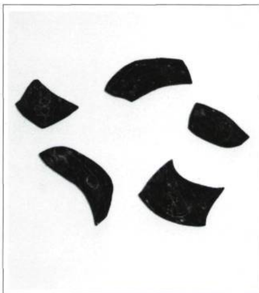
Suzanne Roux, Incidence 6 , 1990. Encaustique sur bois; 130 x 188 cm

«[...] Les formes au mur sur lesquelles j'ai apposé un dessin figuratif forment ensemble des phrases, des rébus. Un parcours de lecture est dressé, qu'il soit circulaire ou ascendant, que chacun est appelé à lire à sa façon. Ce parcours pour le spectateur est temporel. Mon propre parcours a été inscrit dans les dessins qui témoignent de ces vitesses de perception différentes : l'eau, le vent, les nuages ou la stabilité incertaine du volcan. Chacune des pièces évoque des temporalités