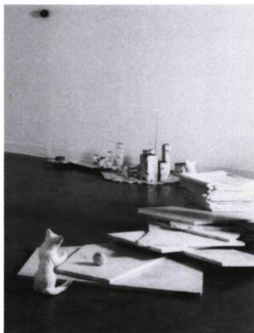
Claude Mongrain, Paysage avec monument , 1989. Plâtre, marbre, bois, mousse de polystyrène, pierre, objets, radio à transistor, approx. 6 m de diamètre.

choisit, trie, assemble, rassemble. Formes, matériaux, objets trouvés sont réunis puis exposés à l'état brut pour ainsi dire, dépouillés de toute trace d'intervention. Non pas qu'il n'y en ait pas — cette colonne d'aluminium ou de zinc, par exemple, est en fait une construction de bois, tout comme ce tas qui ressemble à des tissus pliés est en réalité un moulage de plâtre. Mais rien ne trahit le passage de la main et les traces du travail se fondent avec l'identité de l'objet ou du matériau.