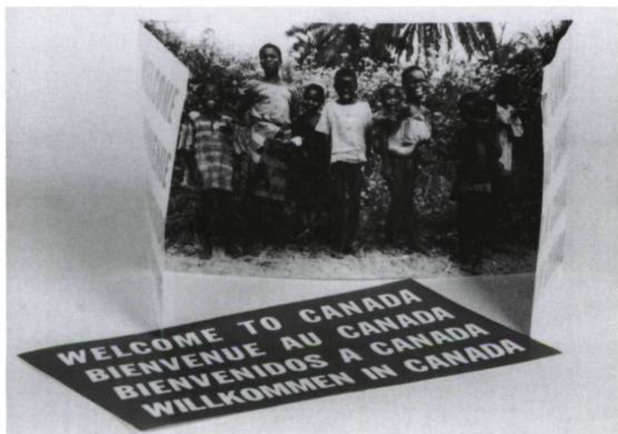
Alfredo Jaar, dépliant Fictions , 1989.

condensés, des fauteuils-télévisions, des banques de change miniatures, des chapelles de poche, etc. Ce néant est pourtant honnête; il est le lieu le plus compétent qui soit parce qu'il avertit de son incompétence, parce que c'est là que nous devons exister pour être ailleurs. Le pacte que nous faisons avec tous les aéroports du monde c'est celui de la raison d'être, pour partir ou arriver, pour se réfugier ou pour attendre, pour accueillir ou se séparer. Ainsi, il est rempli d'intentions (de bonnes) et formule l'anatomie même du néant où le monde n'existe que pour devenir.