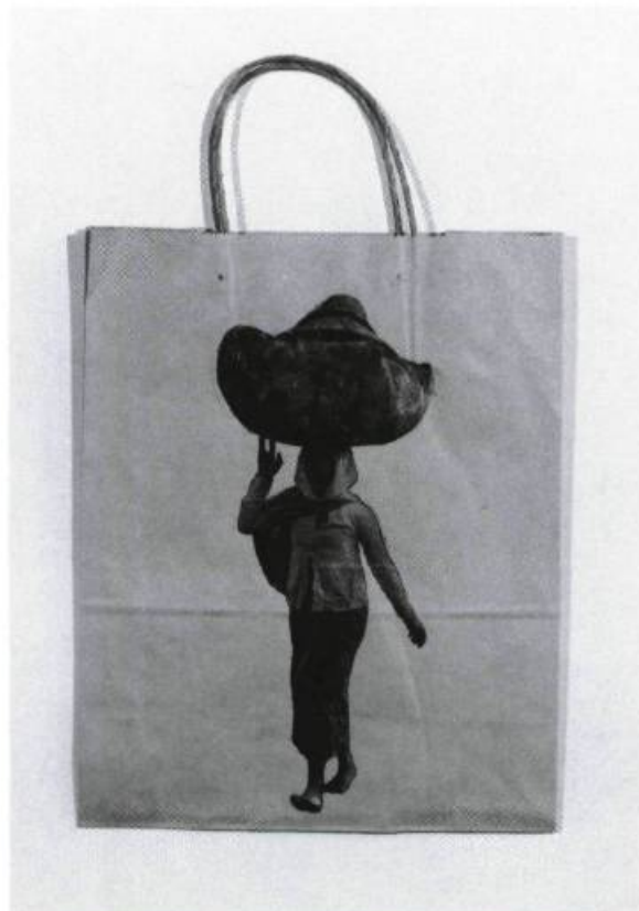
Dominique Blain, Sans titre , 1989. Impression sur sac de papier.