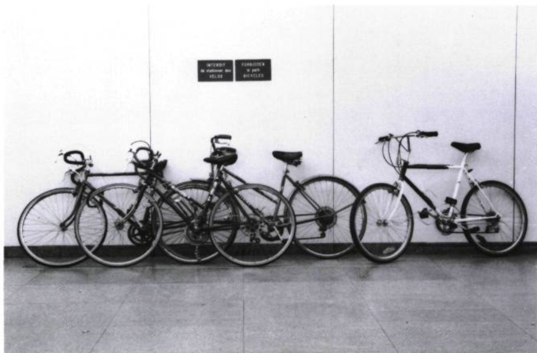
Guillaume Bijl, Installation Fictions , 1989.

en opposition au flux quotidien d'informations que souvent, nous ne désirons pas ou plus.