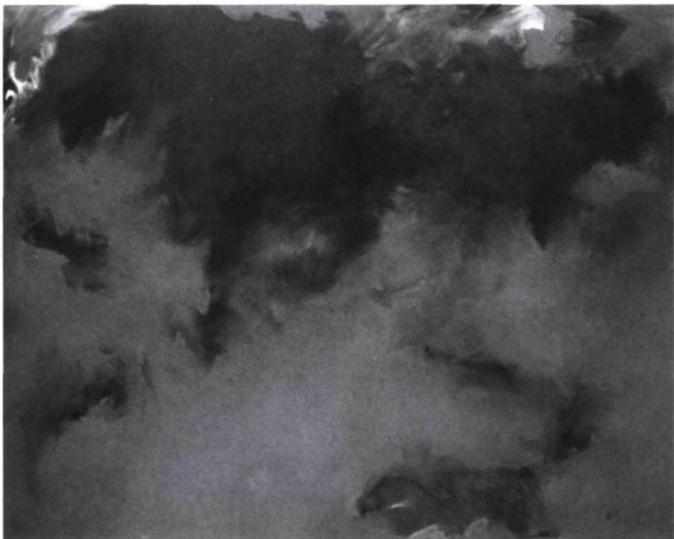
Suzelle Levasseur, N° 184 , 1987. Acrylique sur toile; 175 x 214 cm