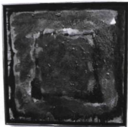
Jean McEwen, Élégie criblée de rose n° 20 , 1987. Huile; 20 x 20 po

ses premières assemblées, le groupe a voulu préciser la «norme de qualité» inscrite à ses règlements pour l'achat d'œuvres. On a donc examiné un ensemble de critères (originalité, diversité, valeur, origine, etc.) qui doivent guider les membres lorsqu'une proposition d'acquisition est présentée à l'assemblée. Les œuvres acquises sont conservées au domicile de l'un ou de l'autre membre et circulent entre les membres selon un calendrier déterminé par le comité de direction.