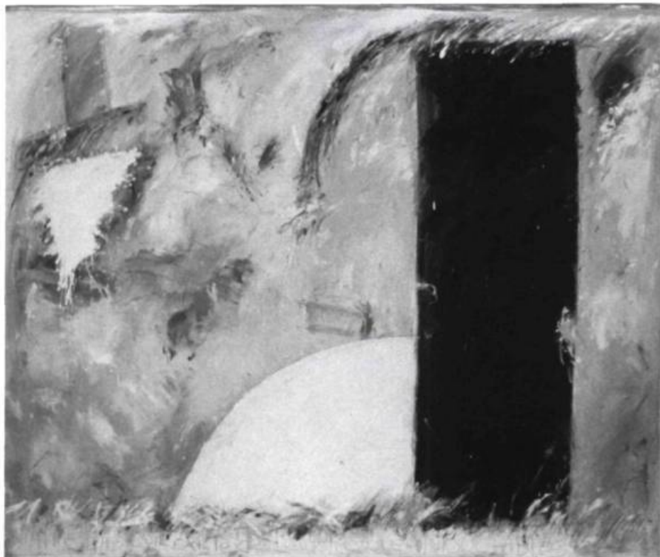
Louise Robert, J'aimerais qu'il existe , 1986. Acrylique sur toile; 5 x 6 pi