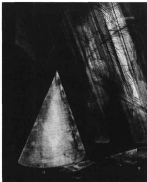
Louis Pelletier, Cathédrale II , 1985. Gravure; 5 x 4 po

Il n'est pas aisé d'acquérir des œuvres d'art contemporain qui satisfassent les goûts respectifs de vingt membres. Ainsi les règlements de la société prévoient-ils qu'une œuvre doit obtenir l'approbation d'au moins les trois quarts des membres pour qu'elle fasse partie de la collection de la société. Au cours de