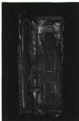
David Luksha, Time and Place , 1988. Construction peinte; 92 x 42 po