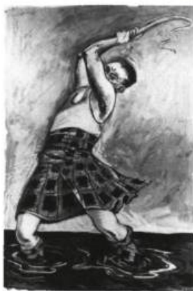
Jack Y. Niven, Rim Thrasher , 1987. Huile sur papier; 75 x 50 po