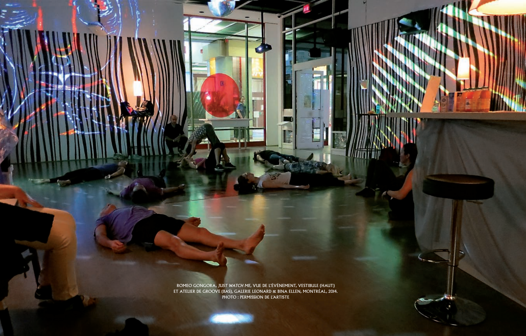
ROMEO GONGORA, JUST WATCH ME , VUE DE L'ÉVÈNEMENT, VESTIBULE (HAUT) ET ATELIER DE GROOVE (BAS), GALERIE LEONARD & BINA ELLEN, MONTRÉAL, 2014.

Just Watch Me A meeting place that encourages dialogue and multi- media creation. It features multiple video installations, displays, and more. It's a place for ideas and expression, an online, community, etc. It's a place for daily events, special opportunities to meet artists in a flexible environment. It's unique, it's inspired by artists' initiatives from the Quiet Revolution. Le espace de rencontre est conçu en dialogue et la création multimedias. Des installations sont multiples, displays, café, spectacles, vidéo de spectacle et de cinéma, rencontres d'artistes, etc. Il s'agit d'un lieu pour des événements et spéciaux, programmes de rencontre des artistes dans un environnement flexible. Une unique est inspirée de initiatives artistiques de la Révolution silencieuse au Québec. www.claipex.com