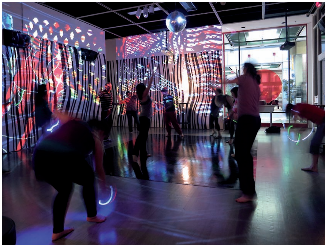
ROMEO GONGORA, VUE DE L'ÉVÈNEMENT, JUST WATCH ME , ATELIER DE GROOVE, GALERIE LEONARD & BINA ELLEN, MONTRÉAL, 2014

Just Watch Me is not only a space for politics, mais un espace politisé. Son verbe est collaboration, dialogue. Un espace organique, VIVANT, qui nous appartient ?