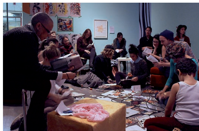
ROMEO GONGORA, JUST WATCH ME, LES NOUS IDENTITAIRES , PERFORMANCE, GALERIE LEONARD & BINA ELLEN, MONTRÉAL, 2014.

les modalités de révocation de la citoyenneté canadienne, « abaisser le seuil permettant aux forces de l'ordre d'appréhender de manière préventive une personne qui pose une menace 4 » pour le pays et octroyer plus de pouvoirs au Service canadien du renseignement de sécurité (SCRS). Enfin, à l'heure où le gouvernement libéral du Québec entreprend, avec ses mesures d'austérité, le démantèlement de plusieurs acquis sociaux, la nécessité de poursuivre tranquillement la révolution est bien réelle.