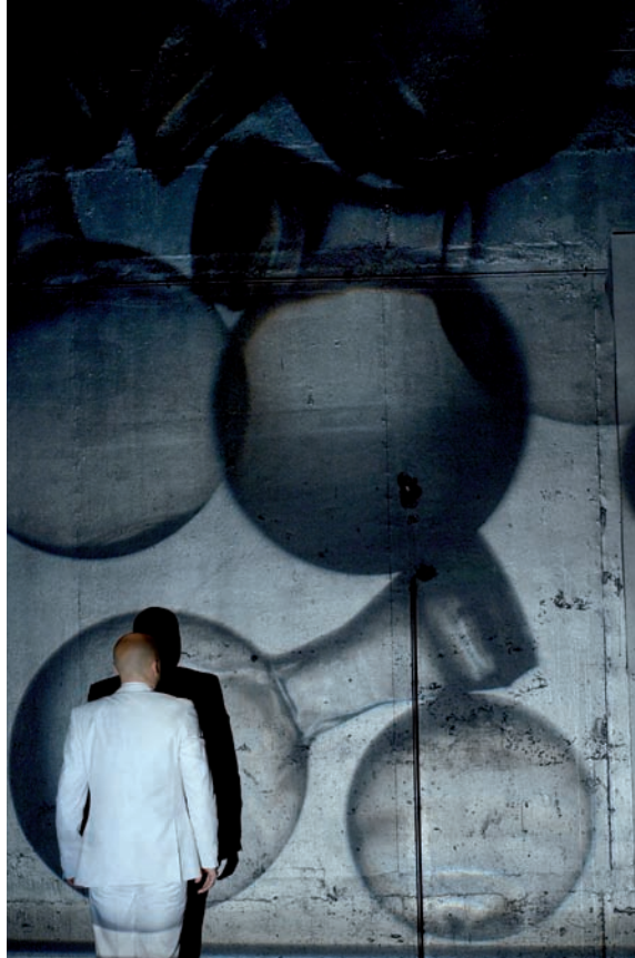
GAÏA GLOBAL CIRCUS, COMÉDIE DE REIMS, 2013.

Even though he talks about certainty in his own account of apocalypse, Latour would most certainly contest a definition of faith that involves a dimension of belief. "Faith and belief have nothing to say to one another" 9 Latour vehemently maintains; a distinctive component of his work aims precisely at debunking the notion of belief. The entirety of