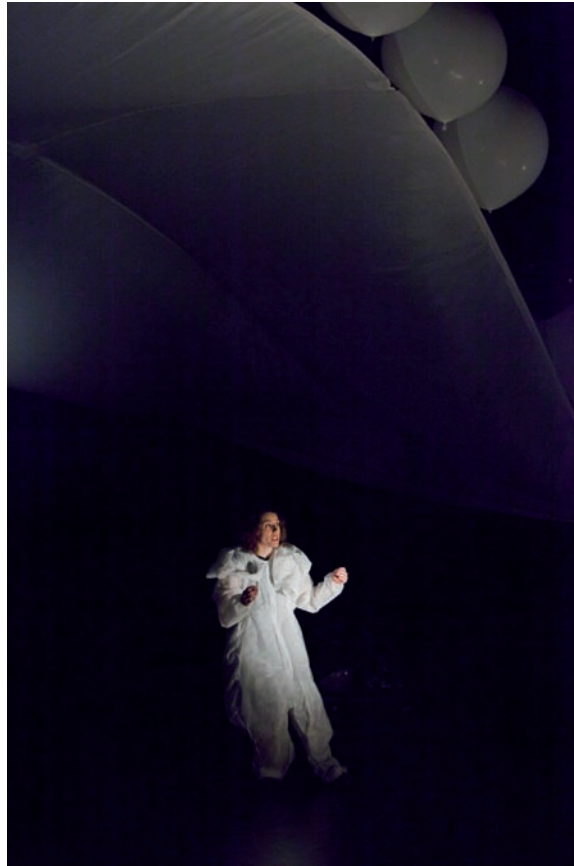
GAÏA GLOBAL CIRCLUS

Theology , souligne comment, pour Latour, la religion est un exercice éthique d'attention immanente visant à rester « avec le trouble » historique (comme dirait Donna Haraway) – un entraînement à vivre et à parler à partir des choses. « La religion , écrit Miller, est ce qui brise notre volonté de se détourner 12 . » Allant à l'encontre de l'association habituelle entre la religion et l'outre-monde, Latour affirme que « c'est la religion