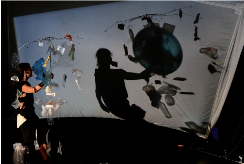
GAÏA GLOBAL CIRCUS

Il existerait donc une forme d'énonciation originale qui parlerait du présent, de la présence définitive, de l'achèvement, de l'accomplissement des temps, et qui, parce qu'elle en parle au présent, devrait toujours se décaler pour compenser l'inévitable glissement de l'instant vers le passé [...] 1