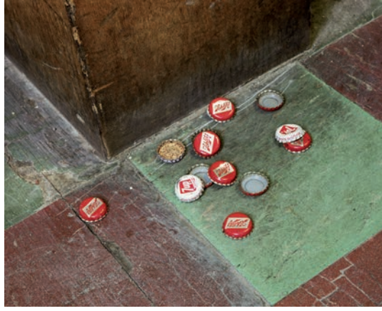
CHRISTIAN PATTERSON, CHARLIE'S BLOODY EAR, 2007.