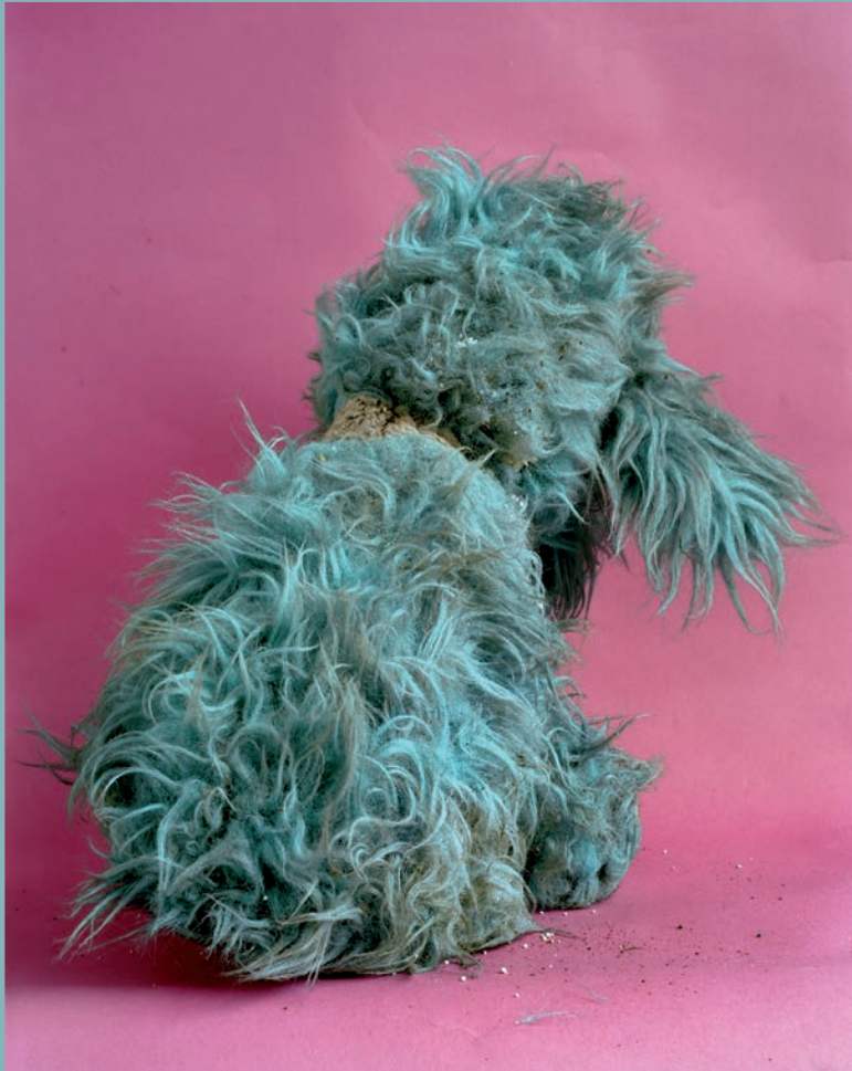
CHRISTIAN PATTERSON, STUFFED TOY POODLE, 2010.