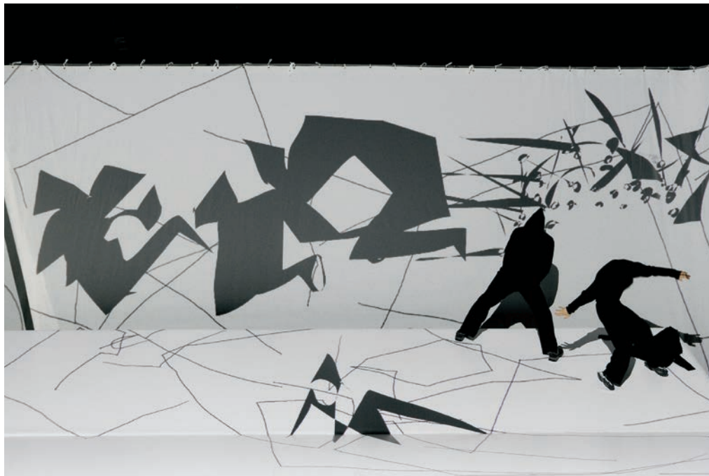
Benoît Lachambre, Is You Me , 2008.

Pierre ou le tissu, pour ne nommer que ceux-ci. Il s'agit ainsi d'accentuer la sensualité de la danse, ou même de la rendre carrément périlleuse avec le risque que peut représenter, par exemple, la chute d'une brique que le danseur lance en l'air dans What the Body Does Not Remember (1987), de Vandekybus.