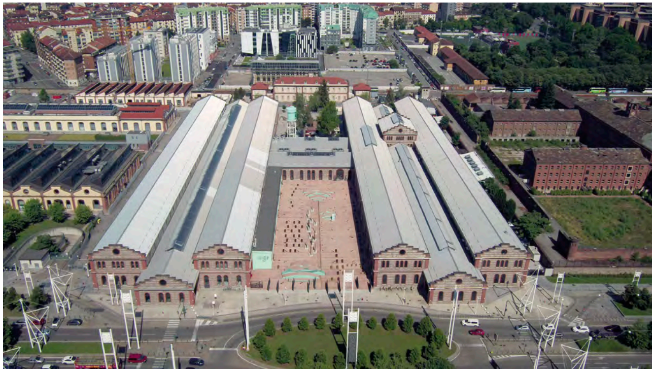
Centre culturel Officine Grandi Riparazioni. Prise de vue aérienne par drone.

industriel et né dans la logique des musées comme dispositifs de relance économique, encourage la création et toute forme de métissage entre les arts. Plateforme dynamique où les arts performatifs se croisent avec les arts visuels, ce musée met en place diverses occasions de recherche et de production artistique, comme des ateliers et des résidences d'artistes. Sa syntaxe spatiale (vingt-deux bâtiments sur une superficie de seize acres, organisés en un réseau de cours et de passerelles surélevées) encourage la jouissance esthétique par le biais de stratégies de médiation ponctuelles. La juxtaposition et la simultanéité des événements proposés investissent notamment la logique du design spatial; ainsi, tandis que l'on profite des expositions et des spectacles temporaires, l'on découvre l'espace et l'architecture.