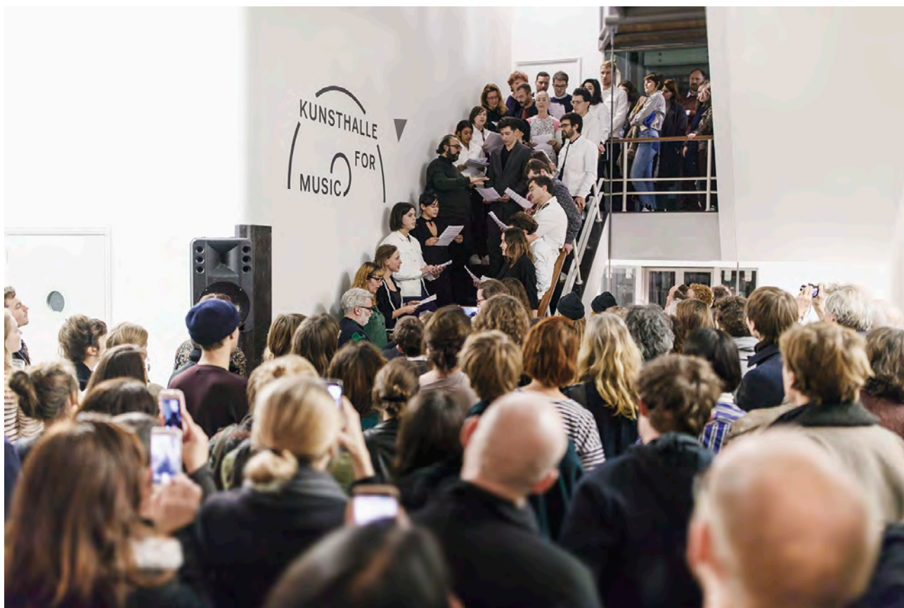
Centre d'art contemporain Witte de With, 2014 (Chu Yun, Unspeakable Happiness II , 2003. Vue de l'installation).