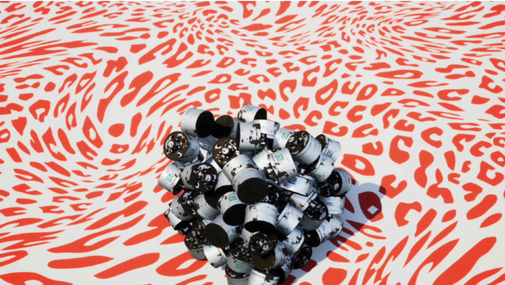
Forensic Architecture/Praxis Films, Decontextualised _1 , 2019. Image tirée de l'enquête Triple-Chaser .