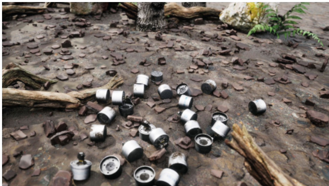
Forensic Architecture/Praxis Films, Photorealistic_1 no mask , 2019. Image tirée de l'enquête Triple-Chaser .

Si le rétablissement des faits, présenté à la Cour suprême d'Italie, a permis d'éviter que les chefs d'accusation contre Jugend Rettet aillent de l'avant, leur navire est aujourd'hui encore aux mains du gouvernement italien qui, à travers cette saga judiciaire arbitraire, a réussi à instaurer un climat de peur et un ralentissement considérable des sauvetages en mer, entraînant des milliers de noyades qui auraient pu être épargnées 4 . Parallèlement, en produisant et en diffusant la vidéo The Crime of Rescue – The Juventa Case (2018), qui relate en détail le contexte des événements et le processus de contre-investigation menée par son équipe, Forensic Architecture contribue à une sensibilisation du public quant à la réalité de ces enjeux humanitaires en proie à la manipulation médiatique et gouvernementale. Présentée dans plus d'une dizaine d'expositions à travers le monde, entre