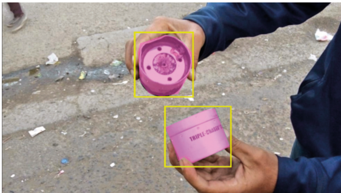
Forensic Architecture/Praxis Films, Bounding Box_1 , 2019. Image tirée de l'enquête Triple-Chaser .