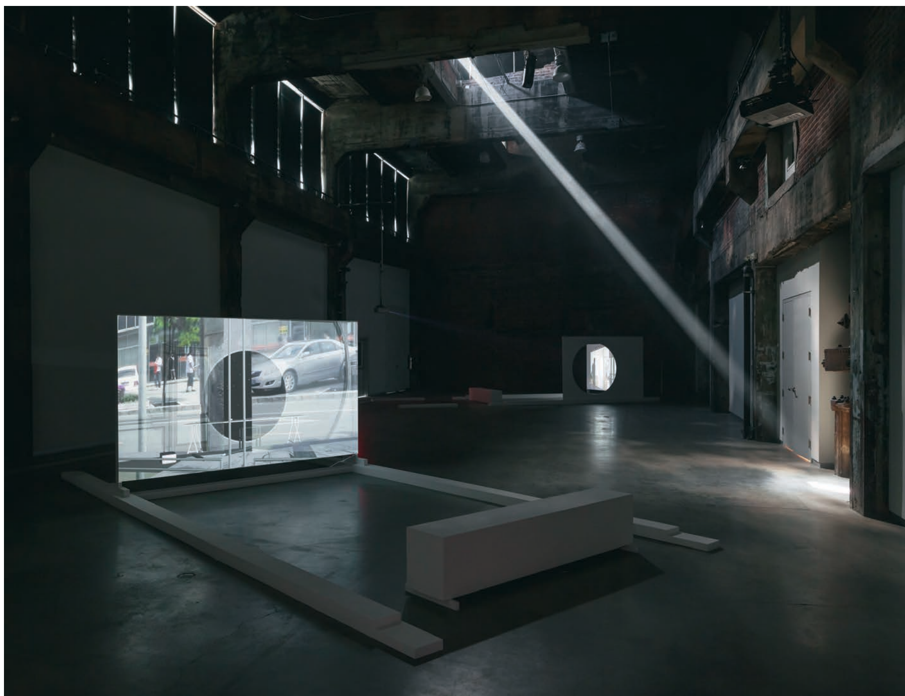
Yam LAU, Between the Past and the Present: Lived Moments in Beijing , 2013.

galerie. Lau explique son installation en disant qu'il perçoit «la structure de bois "supportant" la vidéo tel un bateau, une île, tel un pavillon flottant sur l'eau. Je crois également, poursuit-il, que l'énorme espace de la galerie ressemble aux jardins de pierre japonais, le vide étant perforé par mes structures de bois, comme si les deux œuvres flottaient dans un temps infini 2 .»