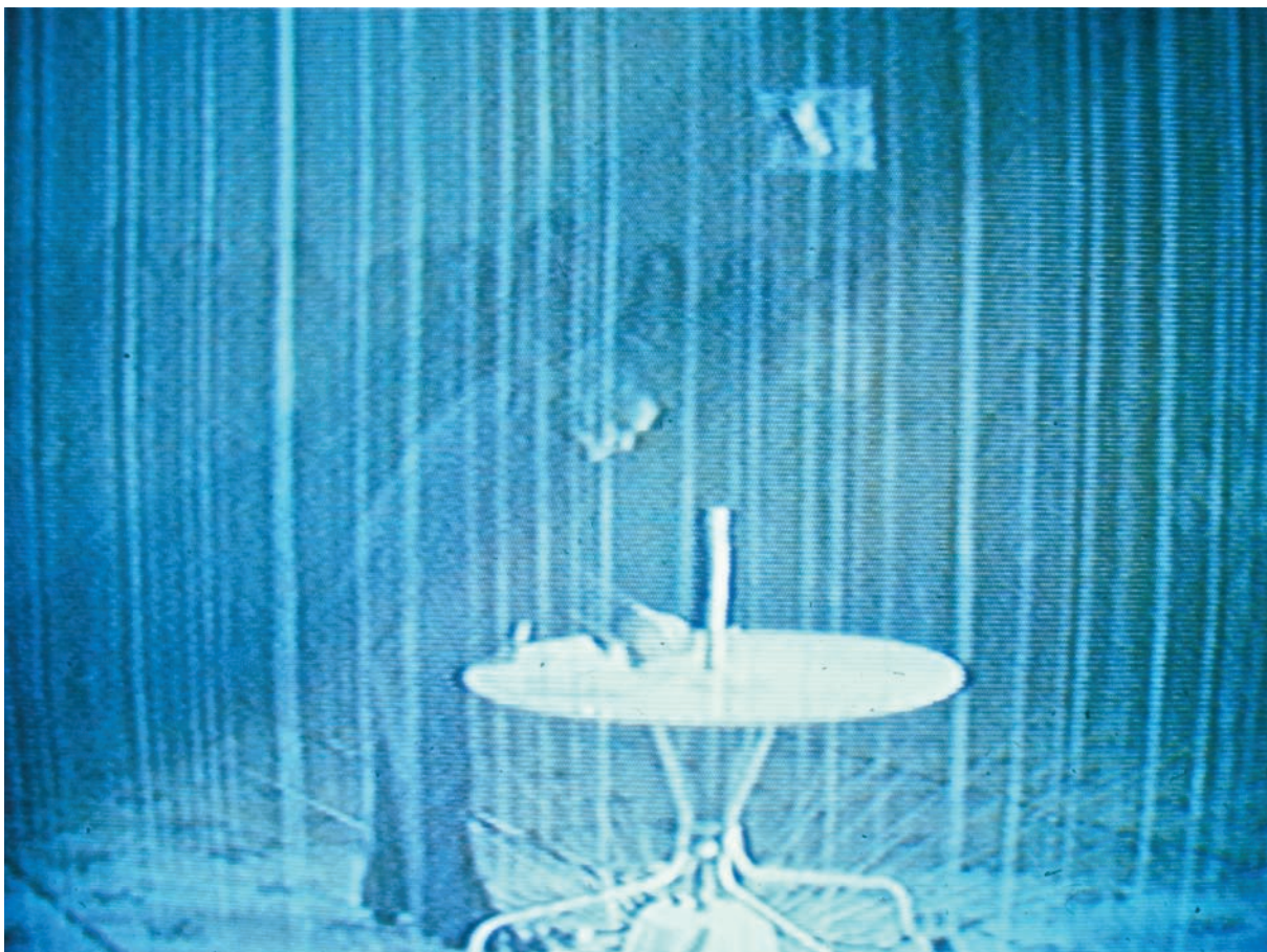
Rober RACINE durant la performance Dérouler, dérouler, dérouler... , une œuvre qui explore le thème du «déroutement» temporel, spatial, physique et immatériel. Présentée lors du Festival de performances Hors-Jeux en 1979, au Musée d'art contemporain de Montréal / Rober RACINE during the performance Dérouler, dérouler, dérouler... . A work that explores the theme of temporal, spatial, physical and immaterial "unfolding." Presented during the Festival de performances Hors-Jeux in 1979, at the Musée d'art contemporain de Montréal.

← Rober RACINE au piano interprète les 840 Vexations de Erik Satie à la galerie Véhicule Art, à Montréal, le 4 novembre 1978 / Rober RACINE on piano performing the 840 Vexations by Erik Satie, Montreal, November 4, 1978.