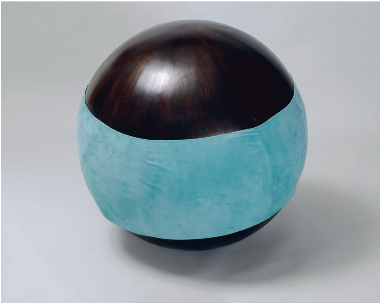
Martha TOWNSEND , Morning Sphere , 1988. Cèdre peint et suède. Collection Musée national des beaux-arts du Québec (1994.231).