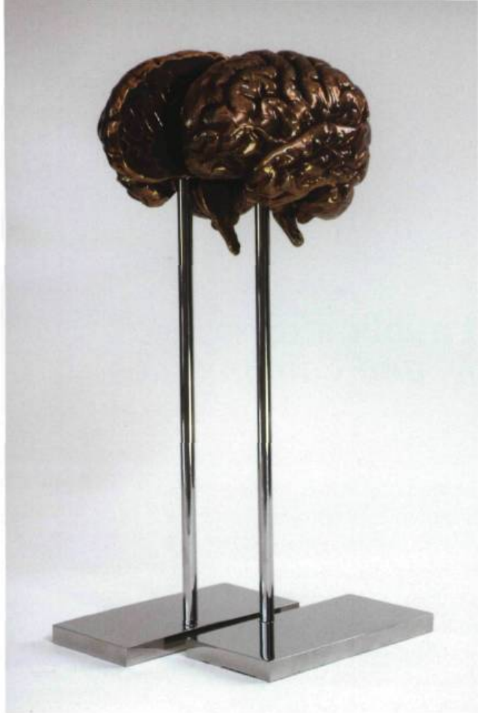
Normand MOFFAT, Matière précieuse , 2009. Bronze et acier inoxydable. 38 x 13 x 13 cm. Réalisation : Atelier du bronze. Voir / See En bref / In brief ( www.espace-sculpture.com )