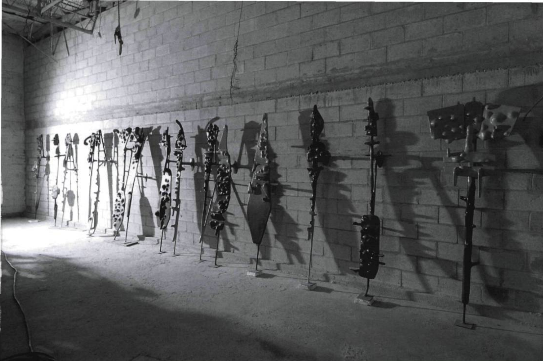
← WALTER REDINGER, God Seekers , 2003. Mixed Media, 15 units, each unit up to 228.6 x 76 x 45.7 cm.

Au départ, il y avait trois petits vaisseaux, mais je n'aimais pas cette idée de trois éléments. Dans cette version plus récente, j'en ai éliminé deux et me suis concentré sur un seul de grande dimension, soit 3,6 x 12,8 x 2,7 mètres. Tous les joints de la structure sont en fibre de verre — un mélange de fibre et de bois —, attachés et reliés ensemble.