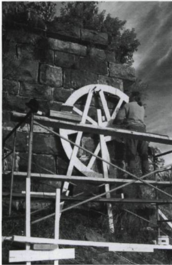
DOMINIQUE LAQUERRE, Repère de Sainte-Clotilde-de-Horton , en cours de réalisation sur les deux emprises du pont démolé en 1958, octobre 2002. En collaboration avec l'Atelier Silex.

l'un se trouve à l'embouchure (Nicolet-Sud) et l'autre à la source (Saints-Martyrs-Canadiens) à environ 150 km de distance. Chacun des quatre repères comporte un thème réunissant les témoignages semblables de plusieurs individus. Ceux-ci, gravés sur un cédérom inséré à l'intérieur des cailloux ou encore dans les parois rocheuses sur le bord de la rivière, seront peut-être entendus ou vus par des générations futures. L'œuvre déposée sur le terrain de la Maison de Rodolphe-Duguay a pour thème les arts, le repère à Notre-Dame-de-Ham évoque les effets psychologiques de l'eau sur l'univers émotif de l'être humain. Le thème retenu pour Sainte-Clotilde illustre les usages économiques et énergétiques de la rivière et, au lac Nicolet, à Saints-Martyrs-Canadiens, l'œuvre aborde la notion de pureté à la source du cours d'eau. Les repères se sont vus immergés ou déposés dans un endroit spécifique sur le parcours de la Nicolet.