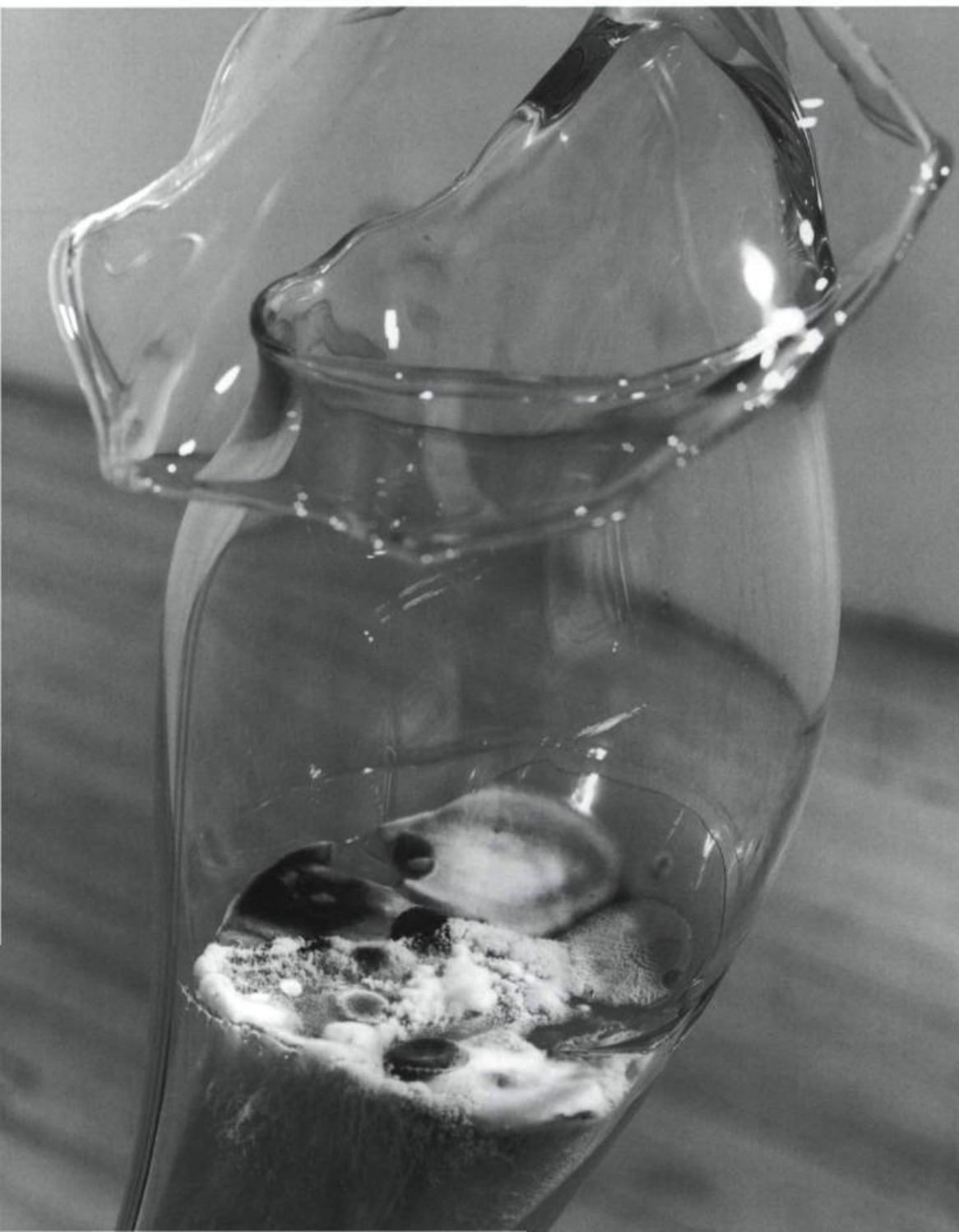
Annie Thibault, Captteur d'essence , 1999. Verre soufflé, solution nutritive d'agar-agar (gélose), spores et bactéries de l'air ambiant.

Durant des siècles, le discours sur la vie — le biologique — s'est exprimé sous forme de chants, d'épopées et de spéculations métaphysique. Depuis longtemps, grâce aux discours poétique et philosophique, la vie s'est faite légende. Ce n'est qu'avec l'avènement des sciences naturelles que le discours s'est transformé en connaissance abstraite. La biologie moderne, en se détournant des anciennes cosmologies, s'est orientée uniquement vers les propriétés et les mécanismes du vivant. En ce sens, le discours biologique moderne a complètement coupé avec les anciennes superstitions auxquelles correspondaient encore les théories « vitalistes ». Car trop spéculatives et relevant parfois même de la mythologie, la science moderne a mis de côté les anciennes conceptions de la nature. Ce faisant, la compréhension du vivant par la biologie acquerra un pouvoir immense : celui de cultiver la vie. Grâce à la domestication du vivant, la biologie peut désormais reproduire la vie. Une vie qui, grâce au pouvoir technicien, combat les déficiences, les