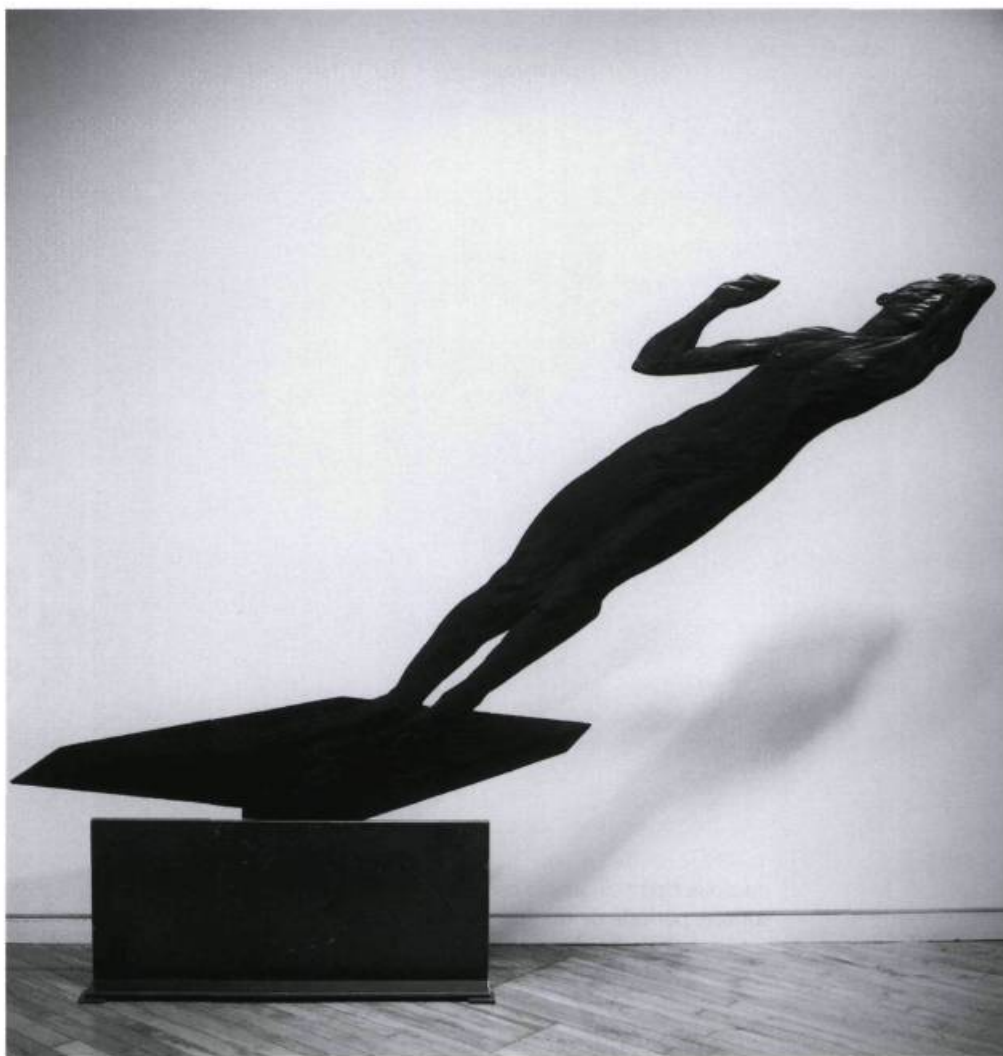
Evan Penny, Anamorphic projection #1, 1995-96. Bronze. 3,04 x 2,13 m.

body. I get so caught up in the time, the particulars of the narrative: a lot of the time you're reading anything but the subject, which is the person. Behind most of the work there was a model, a real person that it was based on... behind all those layers there's the chance of identifying one-on-one, or of finding oneself in the image, reclaiming the body..."