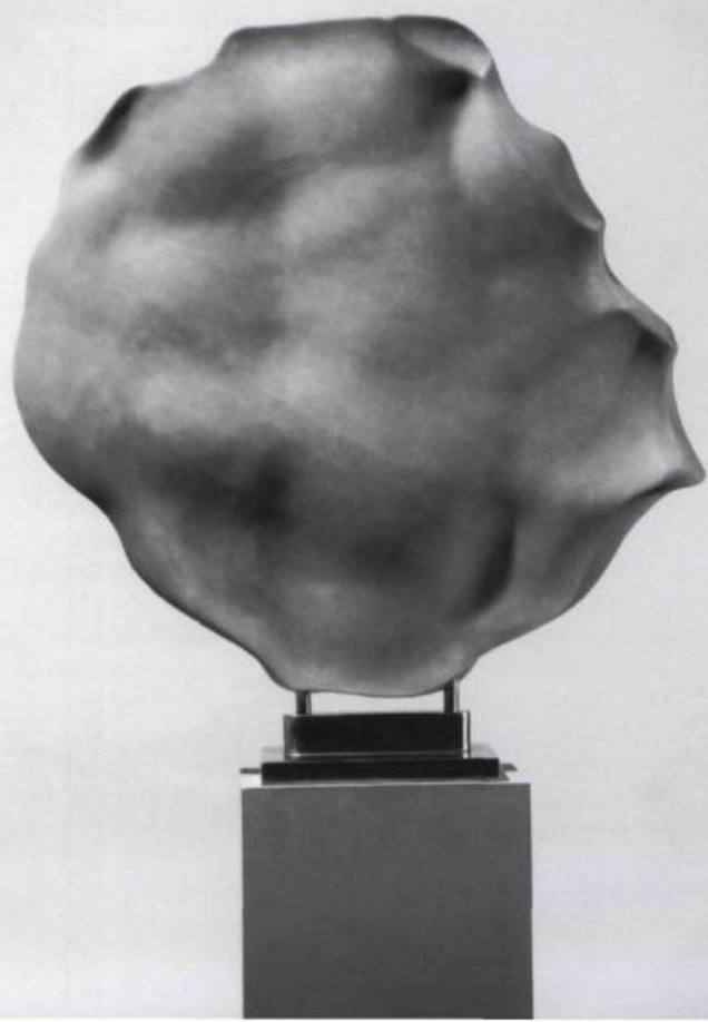
Evan Penny, Polymorph #2, 1996. Polyester resin, flocking, pigment/Résine, floconnage, pigment. 71,12 x 76,2 cm.

The sense of comfort and conventionality that one might expect to find in something as ubiquitous as a nude in an art gallery is not to be found within Penny's oeuvre. Yet he also succeeds in avoiding the