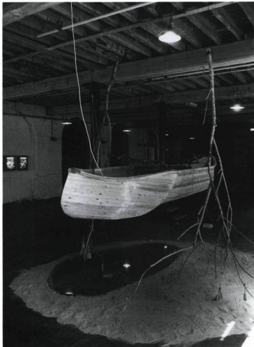
Doug Buis, Walking Lightly , 1992. Canoë, bois, branches, moteur, sable, eau. 4,26 x 3,65 x 3,04 m.