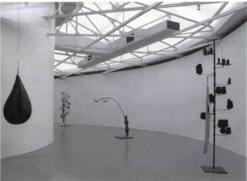
Louise Bourgeois, Sculptures, environnements, dessins 1938-1995, ARC Musée d'Art Moderne de la Ville de Paris, 1995. De gauche à droite : L'air, 1986. Caoutchouc, 109,2 x 53,3 x 53,3 cm; In Respite, 1993. Acier, fil, caoutchouc, 328,9 x 81,2 x 71,1 cm; Poids, 1992. Acier, verre et eau, 238,7 x 304,8 x 68,5 cm; Sutures, 1993. Acier, fil, caoutchouc, aiguille et épingle émaillée, 274,3 x 104,1 x 88,9 cm.

Louise Bourgeois has run an exemplary and emblematic course in her way of approaching the creative act. Though Art is more than ever autobiographical, it is paradoxically through the personal and singular experience that one attains to the universal. The pain attendant upon exile is a recurrent theme in Bourgeois's oeuvre, and well it should. Indeed, in a voluntary break with the past, Bourgeois left her native France at the age of twenty-seven for the United States. Against the white walls of the museum are reflected the traces of an existence, traces of an intimacy that Bourgeois seeks to appropriate by recreating around her the comforting universe of a golden age. The raw, lukewarm materials of rubber, water, thread and glass evoke the maternal figure of weaver and protector. Bourgeois's quest for stability, solidity and a sure place to lean, somehow wends its way through uncertain paths, as though she were revealing that her very strength lay somehow in her fragility.