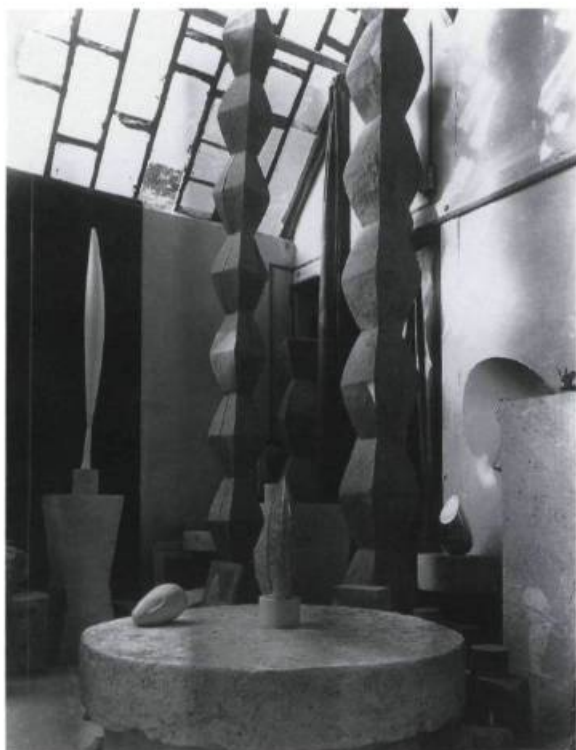
Constantin Brancusi, vue d'atelier, vers 1930-1933.