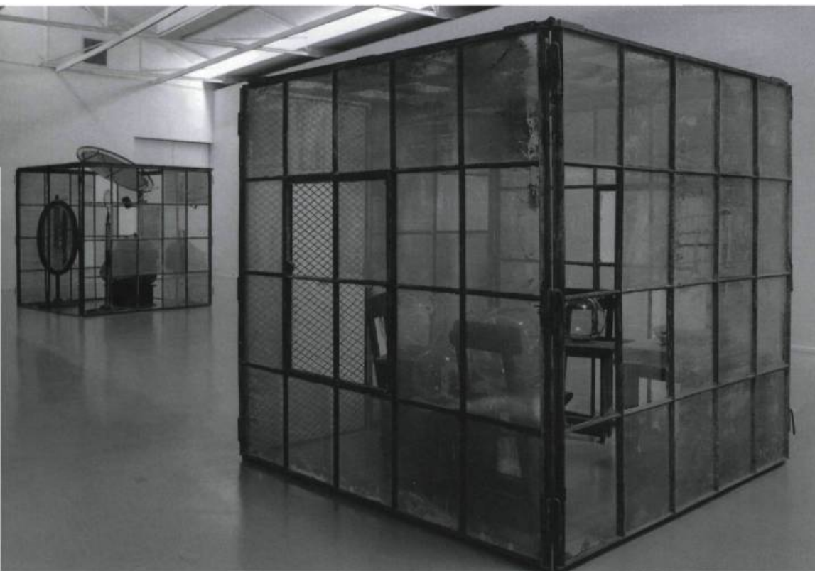
Louise Bourgeois, Sculptures, environnements, dessins, 1938-1995. ARC Musée d'Art Moderne de la Ville de Paris, 1995. D'avant en arrière : Cell (Glass, Spheres and Hands), 1990-1993. Verre, marbre, bois, métal et tissu. 218,4 x 218,4 x 210,8 cm. National Gallery of Victoria, Melbourne; Cell (Eyes and Mirrors), 1989-1993. Marbre, miroirs, acier et verre. 236,2 x 210,8 x 218,5 cm. The Tate Gallery, Londres.

rière artistique. «Toute mon inspiration vient de mon enfance...», déclare Louise Bourgeois, elle est issue des sentiments passionnels de la jeunesse qui transforme chaque atteinte aux sentiments en blessure.