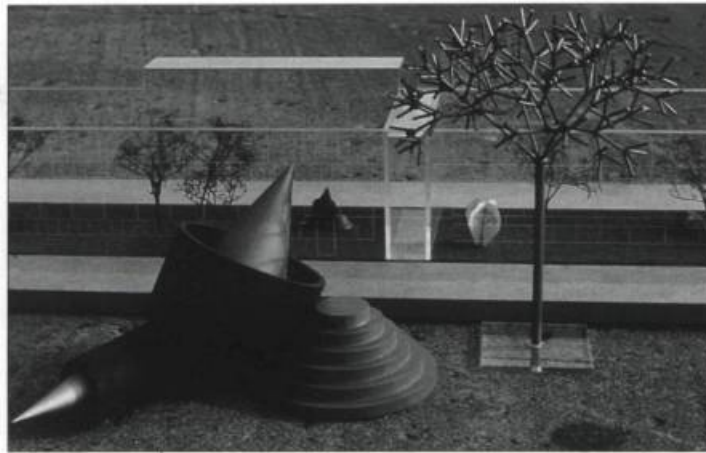
Liliana Berezowsky, Jardins Fractals , 1994. Variation d'arbres et de cylindres / Variation of trees and cylinders.

Traduction : Éric Chabot, Karl Desjardins