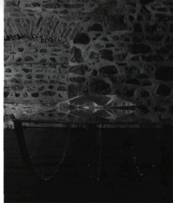
Agnès Dumouchel, Le sommeil d'Ophélie , 1993. Détail.

Agnès Dumouchel's latest exhibition, Le Sommeil d'Ophélie ( The Sleep of Ophelia ), indicates a clean break in her artistic itinerary. Involving the rites of ritual initiation, it calls for full participation of the viewer in order to be properly enjoyed. Through a singular experience that partakes of renunciation and dispossession, the viewers are made to confront their own vulnerability. The body becomes object, central element of the installation. Le Sommeil d'Ophélie invites us on an internal sea voyage where we are thrown from dream to anguish, and invited to measure the stakes of conformity. The commentary pursues this initial interrogation, treating the questions of legitimation and of the space that is allowed creativity.