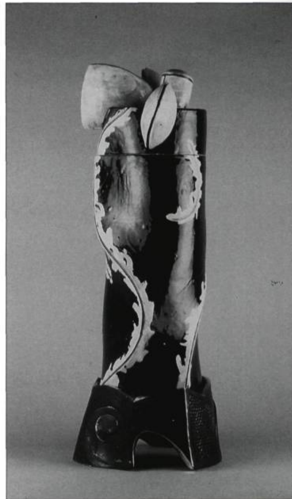
Paul Mathieu, Urne funéraire , 1985-89. Céramique et bronze. 69,8 cm.

First principle: universality. Pottery is crafted in all cultures. In the first category, crisis heterotopias, we had the hospitals. An example in ceramic could be the toilet bowl. The bathroom is itself an interesting ceramic space; to use the contemporary jargon, it is at once a site specific and an installation. In the second category, deviational heterotopias, we had retirement