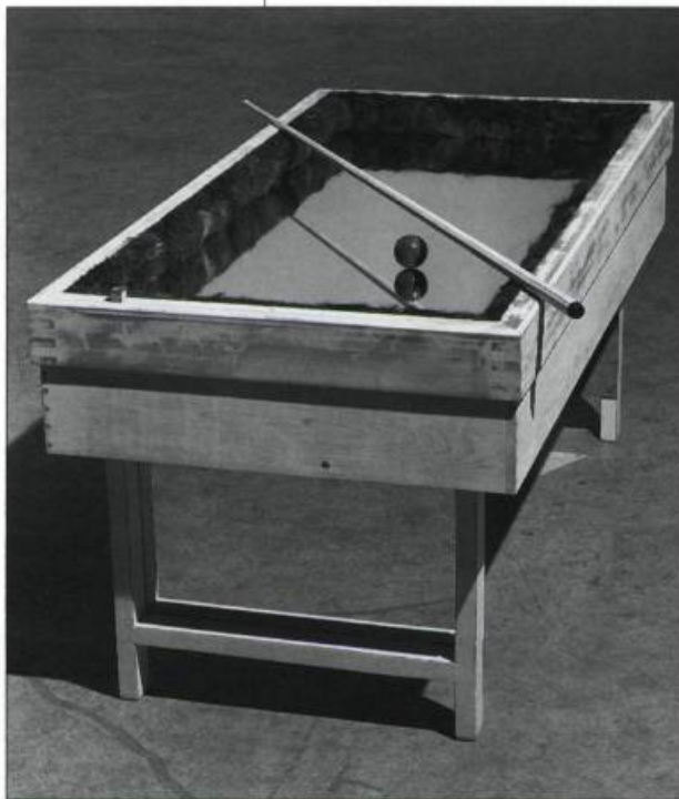
Tim Whiten, Courting the Caliph's Daughter , 1993. Wood, mirror, human hair. 165,1 x 83,8 x 86,3 cm.

In Courting the Caliph's Daughter , a pool table is constructed with a mirror in place of the green felt top. Around the edges, human hair has been applied to act as padding for the bumpers. There is only one red, stone billiard ball and one cue stick. There are no pockets. The cue is as long as the artist is tall. It is in fact longer than the table itself,