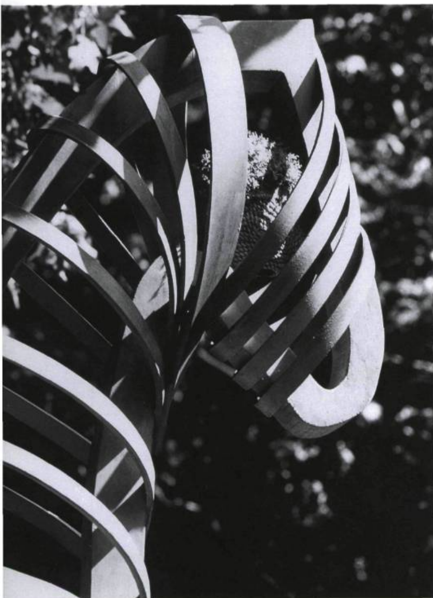
Louise Viger, Les promenés : l'homme carrousel , 1992. Détail. Bois, végétaux. Maison Hamel-Bruneau, été 1992.

comme une faute. Oublier par rapport à quoi ? Quelle est la somme du texte ? Des sens peuvent bien être oubliés, mais seulement si l'on a choisi de porter sur le texte un regard singulier. La lecture cependant ne consiste pas à arrêter la chaîne des systèmes, à fonder une vérité, une légalité du texte et par conséquent à provoquer les "fautes" de son lecteur; elle consiste à embrayer ces