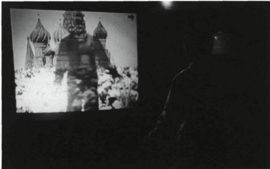
François Giroux, Installation Infographique Interactive (I 1 ) , 1990. Détail de l'installation.

est survenue, un éclatement et un éloignement des frontières connues, une démesure qui s'installe désormais : sortir hors de ses limites, devenir illimité! Et l'art, par le biais