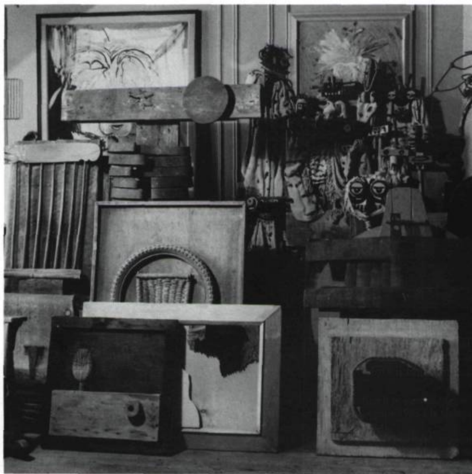
Vue partielle de l'atelier.