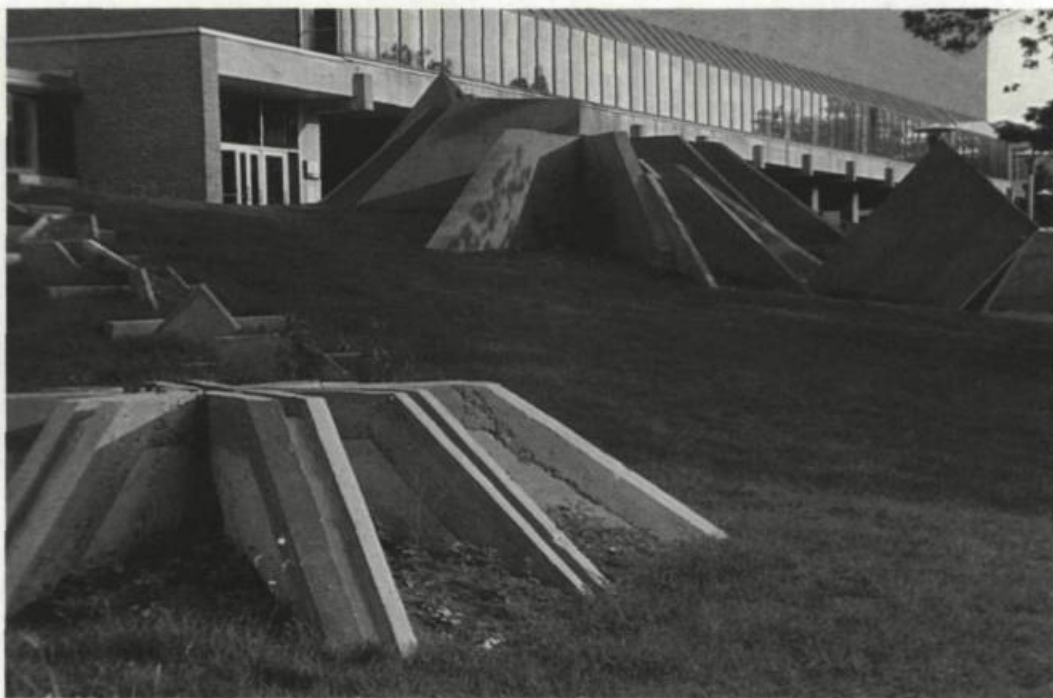
Pierre Granche, Topographie / topologie , 1980. Université de Montréal. [Détail, été 88].

Notre périple nous amène maintenant au stéréotype des dysfonctionnements, à savoir le vandalisme ou modifications apportées par le citoyen anonyme et non plus "honnête" comme dans les cas de censure. Pour éviter de condamner abusivement les auteurs de ces modifications imprévues, Gamboni utilise l'expression d'iconoclasme plutôt que de vandalisme 6 . Cette neutralisation terminologique permet en effet de jeter un regard plus froid sur les graffiti et de raffiner l'analyse des mobiles. Ces crises, plus fréquentes que les interdictions et les enlèvements intempestifs, seraient à suivre avec le regard attentif que Jeanne Demers et Line McMurray ont porté aux graffiti muraux de Montréal 7 . Il faudrait se munir d'un appareil photo ou d'un carnet de notes et saisir au vol quelques exemples parlants avant que les équipes de nettoyage ne fassent leur travail. En attendant une recherche consciencieuse, regardez toujours attentivement, à l'angle des rues Saint-Denis et Sherbrooke, Le malheureux magnifique de Pierryves Angers dont la blancheur attire les empreintes des artistes spontanés. Le crâne de ce penseur Skin Head du Quartier latin a porté entre autres pendant quelque temps une