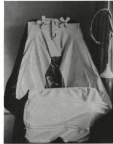
Soft Tub Claes Oldenburg