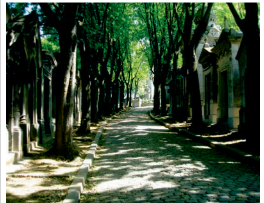
Cimetière du Père-Lachaise, Paris.

«Je suis allée en France la première fois dans le but de faire un pèlerinage Colette. J'ai commencé par le Palais-Royal à Paris, le Père-Lachaise (sa fille est enterrée à côté d'elle). Puis je suis allée à la Treille Muscate à St-Tropez, et à Besançon aussi où Colette et Willy avaient une propriété, et où elle a travaillé sur les derniers Claudine . Voyage émouvant!»