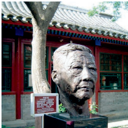
Buste de Lao She, Pékin.