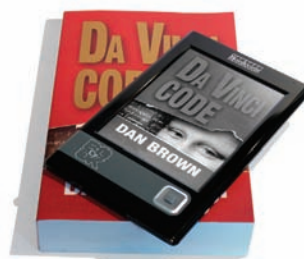
Le Cybook Gen 3