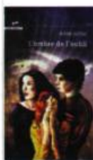
L'OMBRE DE L'OUBLI Anne Jutras Vents d'Ouest 2006, 221 p.

Ce roman fantaisiste m'a accrochée dès la première page. L'auteure nous met magnifiquement en contexte et les protagonistes sont si bien décrits qu'on entre avec aisance dans leur peau. L'intrigue est imprévisible. Les tournants de l'histoire ainsi que les nouveaux personnages que l'on découvre au fil des pages ajoutent du piquant à ce livre haut en suspens. Il est intéressant de suivre l'évolution des trois pensionnaires qui, malgré la discorde qui règne parfois entre eux, apprennent à s'entraider pour se sortir de cet univers glauque et effrayant. Ce roman à l'atmosphère plutôt sombre est un réel bijou de la littérature jeunesse québécoise.