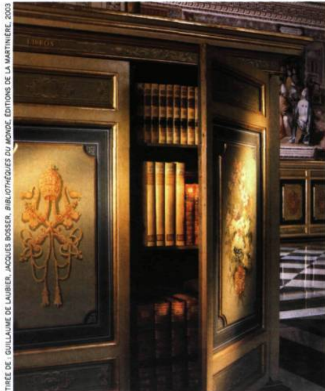
Les livres « cachés » de la bibliothèque vaticane, Rome, Italie.

nauts. Google vient de mettre sur la Toile 15 millions de livres de bibliothèques universitaires. Le tournant technologique a radicalement changé la «physionomie» de la bibliothèque. Désormais, ce n'est plus un lieu à l'atmosphère feutrée et aux planchers qui craquent : les grandes bibliothèques qui apparaissent dans les métropoles internationales (Alexandrie, Tokyo, Alger, Tallin, Dakar, Dubaï, Pékin, Shanghai, Paris, Londres et, bien sûr, Montréal...) sont d'incroyables symboles de prestige, mais aussi des temples de nouvelles technologies qui donnent accès à toutes les connaissances du monde, où que l'on soit. Aujourd'hui, l'usager d'une grande bibliothèque est également spectateur, internaute, consommateur et, bien sûr, lecteur. Comme le disent certains, dans les grandes bibliothèques d'aujourd'hui, le client est roi. ■