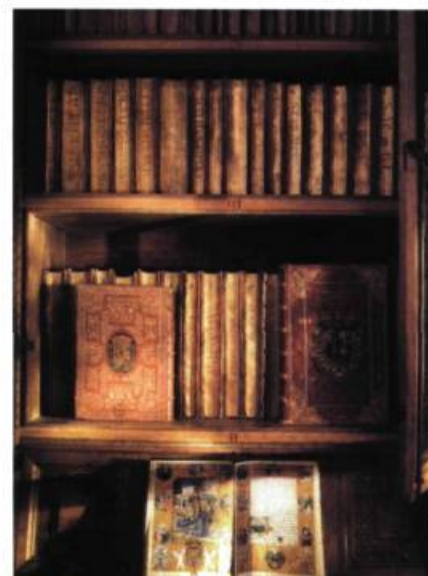
Détail de la Bibliothèque du monastère royal de l'Escorial, Espagne.

des «publiques» : comme à l'époque l'alphabetisation était extrêmement limitée, ces lieux étaient destinés à séduire les érudits dont, de tout temps, les monarques ont aimé s'entourer. À Alexandrie, le monarque Ptolémée 1 er Sôter, sous l'influence d'un conseiller grec, fonde la grandiose bibliothèque dont on connaît le triste sort ( voir encadré p. 32 ), inventant le