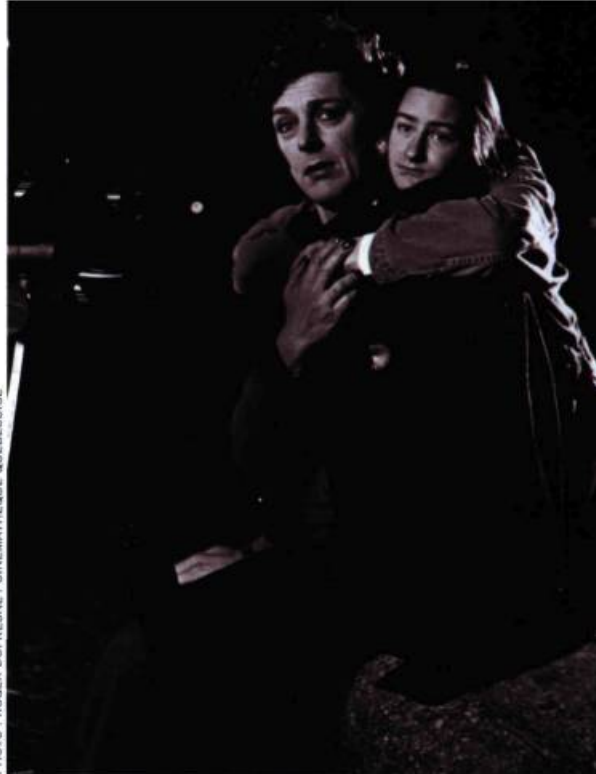
Le Sexe des étoiles de Paule Baillargeon, 1993.

Lire un livre et regarder un film font-ils appel aux mêmes aptitudes ? Pas sûr. « Le spectateur est moins intelligent que le lecteur, affirme Monique Proulx. L'image stimule seulement le cerveau reptilien. On travaille plus en lisant. Et