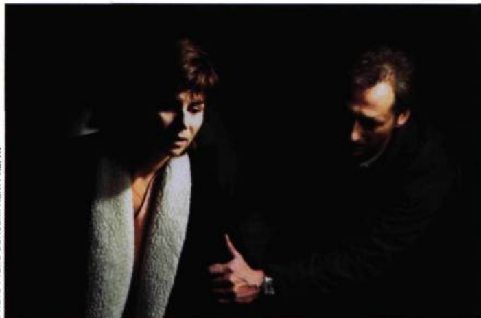
20 h 17, rue Darling de Bernard Émond, 2002.

Même si, dans les années 70, les adaptations se multiplient, dont Kamouraska , de Claude Jutra, d'après le roman d'Anne Hébert, on assiste surtout à l'émergence du cinéma d'auteur, avec les Jutra, Lefebvre, Carle, Arcand : un cinéma de création qui consiste justement à se passer des auteurs.