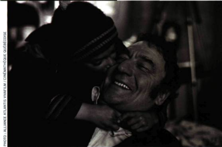
Le Matou de Jean Beaudin, 1985.