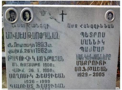
IMAGE 8 : Tombe présentant trois orthographes différentes du même nom de famille arménien, se terminant par « յան », « Յան », « Եան »

d'écrire la terminaison typique du nom de famille arménien « -ian » : par exemple, une fois on le trouve écrit avec l'utilisation de յ (+an) (écrit à tort en minuscules), une autre fois en utilisant le graphème Յ (+an), écrit selon l'orthographe soviétique en lettres capitales, et enfin une autre fois selon l'orthographe actuelle de l'arménien occidental avec la lettre Ե (+an). Un