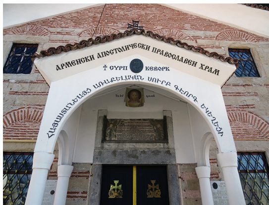
IMAGE 1 : Entrée de l'Église apostolique arménienne « Surp Kevork »