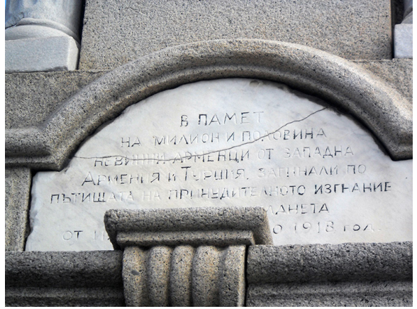
IMAGE 6 : Plaque en bulgare sur la base du monument du génocide