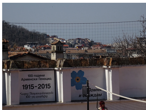
IMAGE 4 : Inscriptions à la mémoire des 100 ans depuis le génocide sur le mur à l'extérieur de l'école arménienne