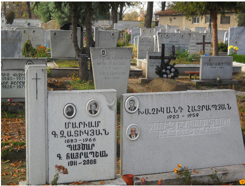
IMAGE 7 : Tombes sur lesquelles figurent des inscriptions en langue arménienne