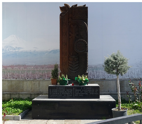
IMAGE 2 : Monument khachkar dédié aux victimes du génocide arménien