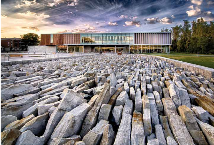
Bibliothèque Raymond-Lévesque, élévation principale

Chef du service des bibliothèques Ville de Longueuil micheline.perreault@ville.longueuil.qc.ca