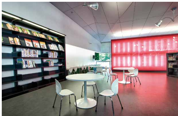
Bibliothèque Raymond-Lévesque, section jeunes

Enfants, adolescents, étudiants, adultes, parents, retraités, aînés, nouveaux arrivants, autant de clientèles différentes qui se retrouvent dans la multiplicité des lieux, autant de besoins spécifiques à satisfaire. Voici un exemple de zone définie de façon spécifique : les parents qui accompagnent leur enfant à l'heure du conte. Dans la section des jeunes, hormis la zone d'animation que l'on retrouve dans toutes les bibliothèques, un espace pour les parents a été aménagé. Une petite collection parentale leur permet de bouquiner en attendant leur enfant. Dans ce secteur, le mobilier a été choisi afin de faciliter le rapprochement parents-enfants et tenter de recréer un espace douillet rappelant le confort domestique. Des causeuses y prennent ainsi place, facilitant la proximité souhaitée pour faire la lecture de contes aux enfants.