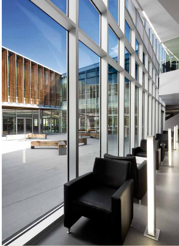
Bibliothèque Raymond-Lévesque, aire de lecture, section jeunes