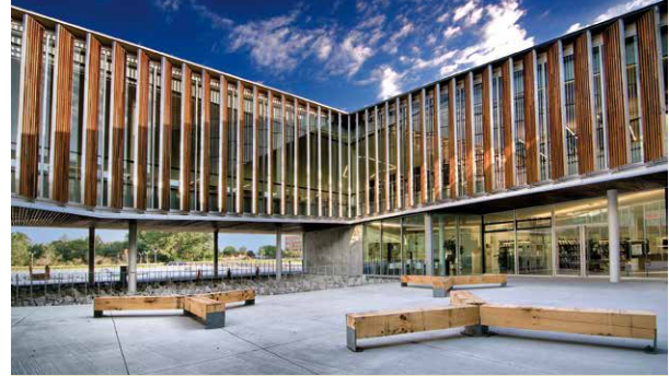
Bibliothèque Raymond-Lévesque, terrasse intérieure

Du troisième lieu de vie, la bibliothèque devient aussi un carrefour communautaire. La meilleure représentation en est le rez-de-chaussée, à la croisée du comptoir de prêt, de l'espace presse, de l'espace jeunes, de la terrasse et à proximité de la salle multifonctionnelle. Ce carrefour est le lieu central où se croisent les citoyens de toutes générations avides de connaissances et qui prennent plaisir à y retrouver le voisinage.