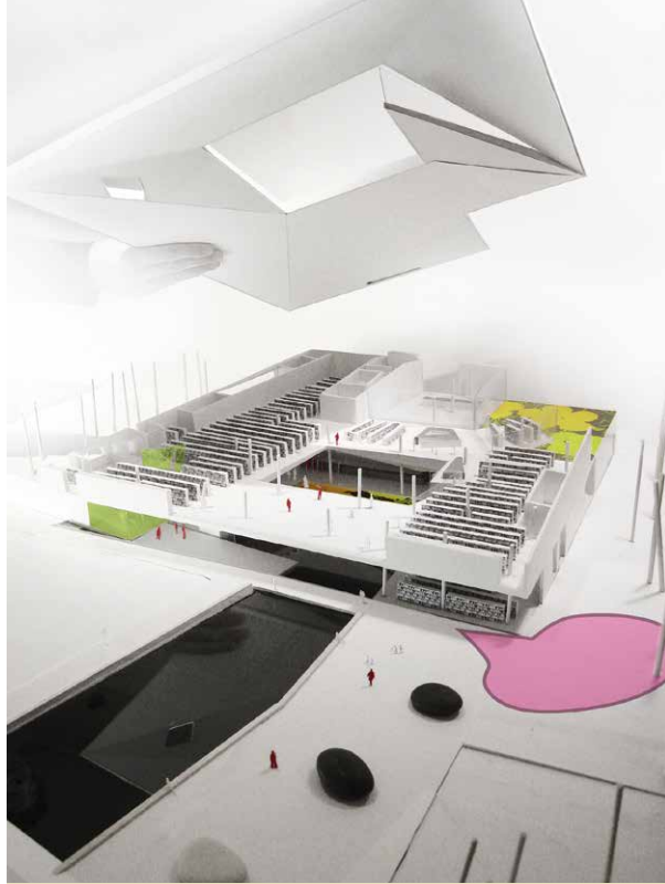
Bibliothèque Raymond-Lévesque, maquette phase concours

La participation des bibliothécaires est tout aussi primordiale dans le déroulement du concours d'architecture afin qu'ils apportent leur expertise dans l'analyse des projets et identifient celui qui est le plus conforme à leur vision. Il arrive d'avoir à convaincre les autres membres du jury que certains aspects, parfois plus séduisants, risquent de compromettre des fonctionnalités bibliothéconomiques. C'est pourquoi il faut avoir une vision claire de ce qui est souhaitable et pouvoir influencer le processus dès cette étape.