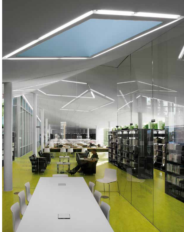
Bibliothèque Raymond-Lévesque, salle de travail d'équipe