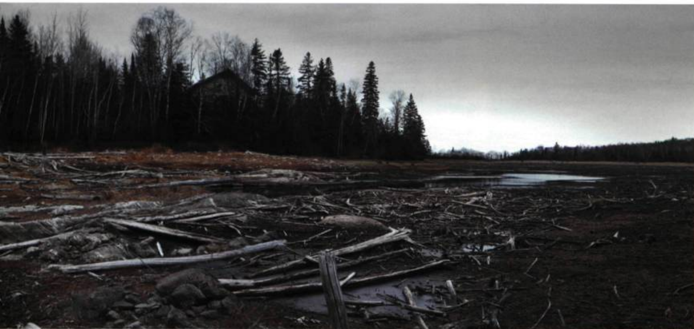
Résidence 91 x 391 cm 2000