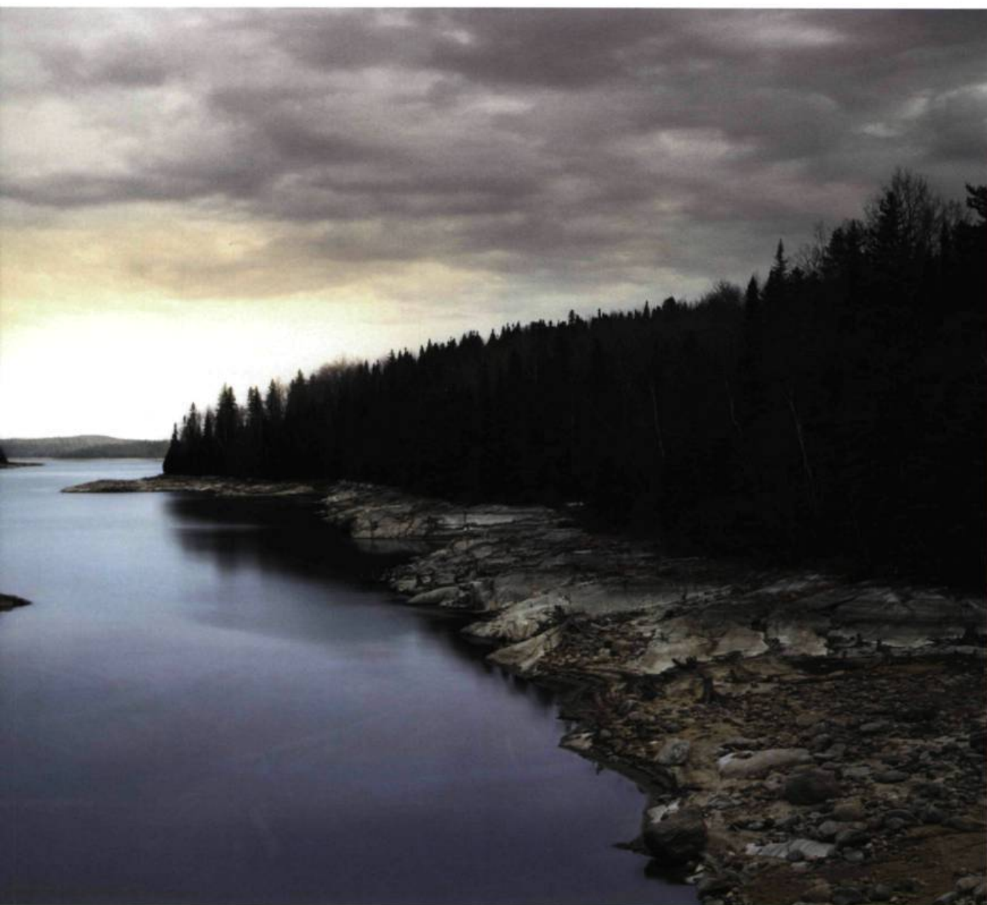
Décharge 111 x 243 cm 1998 Collection de La Banque d'œuvres d'art du Canada