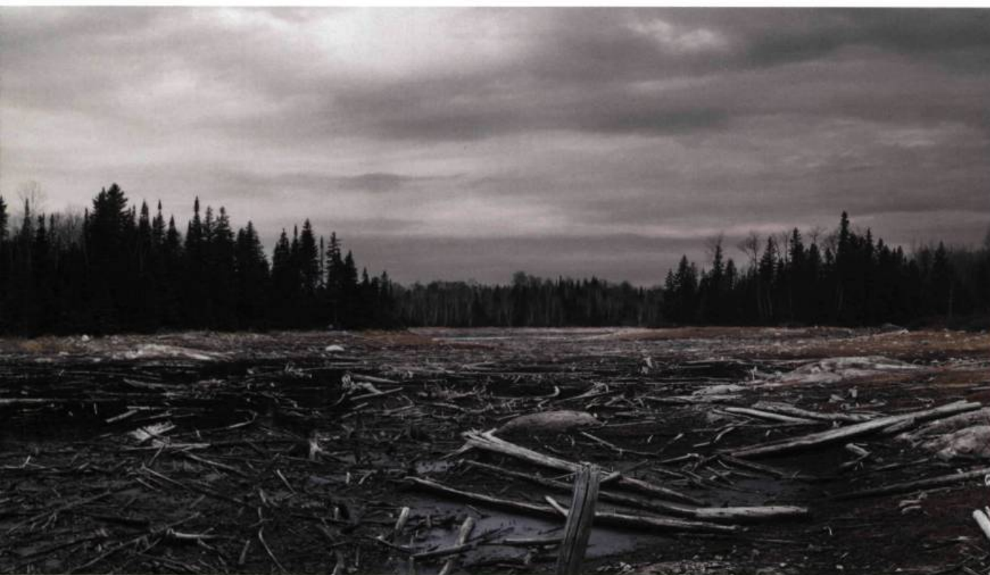
Les bois morts 101 x 351 cm 2000