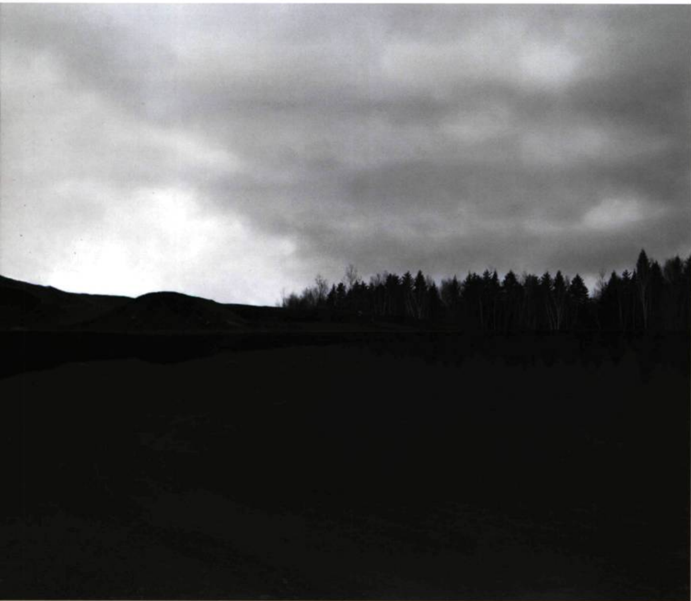
L'île 105 x 243 cm 1998