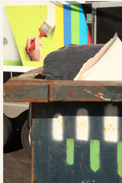
Rue de la Montagne, Griffintown, 2018