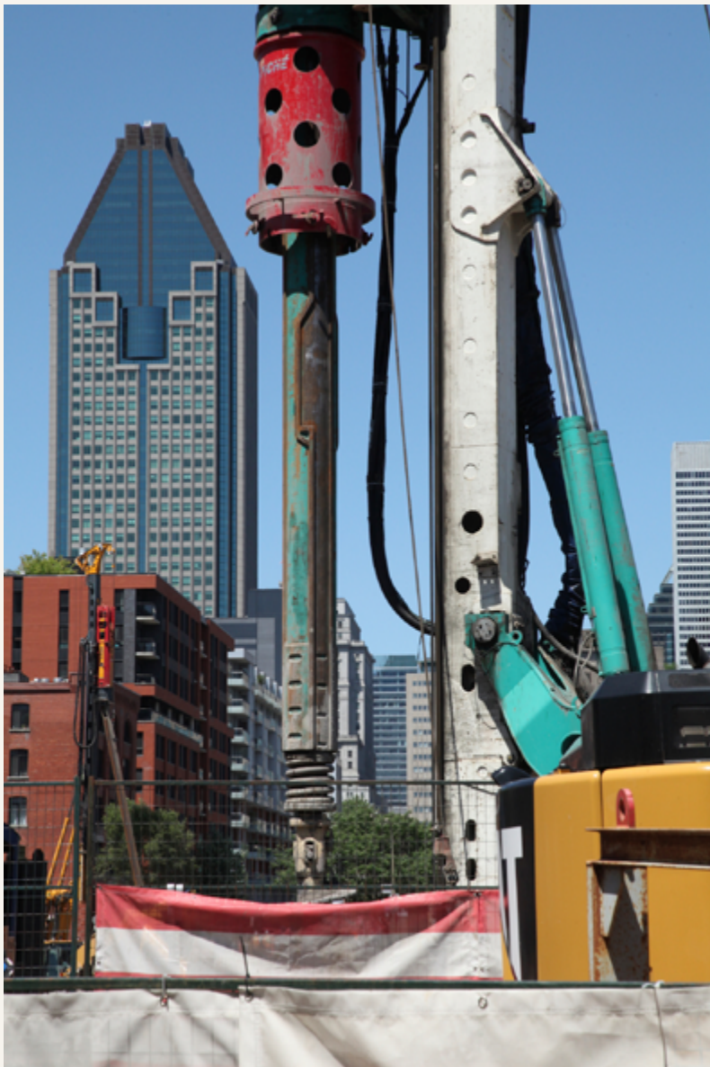
Rue Ottawa, Griffintown, 2018