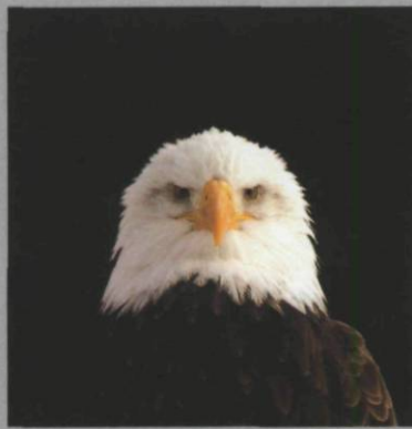
Gabriel, 2008, C-prints, 88 x 85 cm.

Léonard makes telling analogies between her images and central elements of the