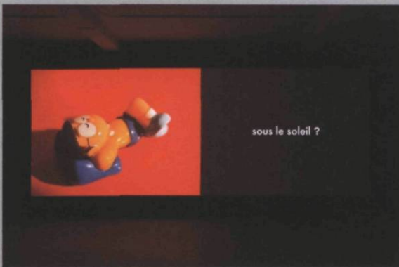
Le plan de la ville , 2006, installation vidéo, dimensions variable.

Cet enseignement dispensé par le temps, Henricks nous le décline à son tour à travers différentes métaphores – la ville, le corps, le bâtiment – qui elles-mêmes s'enchaînent. La ville prend la forme de cartes géographiques et de ruines romaines, de buildings et de graffitis. Ainsi, à la phrase