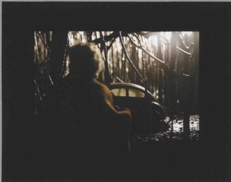
Alain Laframboise, La scène , 2007, S'approchant , 2007, Impressions au jet d'encre , 96 x 122 cm

Parcours, Galerie Graff, Montréal 7 février – 8 mars 2008