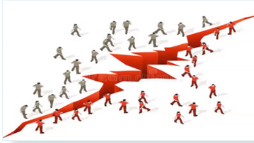
Figure 4. Image partagée par un participant s'exprimant sur son diagnostic. (Crowd Source – Group Separation par James Thew).

Ces exemples mettent en évidence les choix méthodologiques qui accompagnent ma pratique de la sociologie. Les matériaux construits et partagés par les participant.e.s présentent des points de vue de l'intérieur et des mises en scène de soi dans un cadrage contrôlé par ces dernier.ère.s. Toutefois, il serait imprudent de postuler une correspondance parfaite entre les affects et les sensations communiquées par les personnes rencontrées et celles générées chez la chercheure. À cet égard, je cultive le doute dans mes interprétations, je veille à valider mes compréhensions avec les participant.e.s et j'aborde avec elleux les façons dont je compte en rendre compte 10 . J'estime que ma pratique sociologique, visant à décrire, à mieux comprendre et à expliquer (Hamel, 2006), s'inscrit dans un processus de double coconstruction (Courcy, des Rivières-Pigeon et Modak, 2016). D'un côté, de la part de la chercheure qui reçoit et interprète un récit construit puis commenté. De l'autre côté, de la part de la personne qui sélectionne les matériaux qu'il lui importe de communiquer sur son quotidien et s'ajuste en fonction de la compréhension que lui renvoie la chercheure. En somme, la participation active des participant.e.s à la construction des données permet de saisir des processus d'individuation et de subjectivation à l'œuvre chez des sujets agissant qui