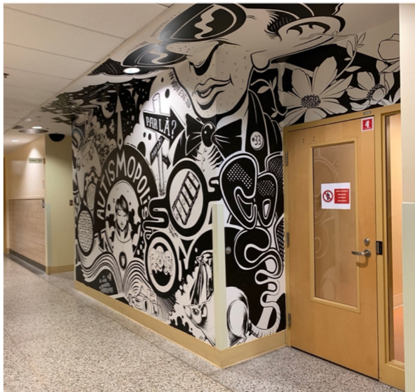
Figure 3. Photo de la murale (Courcy, Bureau et Grenier, 2022)

rience qui m'est partagée. Il arrive que des personnes se donnent l'objectif explicite de me « faire vivre » les difficultés quotidiennes qu'elles rencontrent dans des contextes relationnels, sensoriels et cognitifs (voir Figure 4). Une participante a par exemple enregistré les bruits dans un restaurant : les ustensiles et la vaisselle qui s'entrechoquent, les multiples conversations provenant des différentes tables, la musique de fond plus ou moins forte, etc. Il arrive également que des participant.e.s utilisent le dispositif méthodologique pour mettre en évidence des inégalités vécues, en me montrant par exemple une lettre de dénonciation, une contravention injuste, des propos offensants dans les journaux à l'égard des a/Autistes ou des conversations illustrant le développement d'un malentendu avec des proches. D'autres illustrent des aspects sensoriels et esthétiques qui leur sont source de plaisir et de joie (ex. la brillance d'un candélabre en cristal, le détail d'un circuit électrique, le son de la pluie). Ces partages me permettent de mieux comprendre en me donnant à voir un rapport au monde particulier au fondement de leur expérience quotidienne et de leur identité.