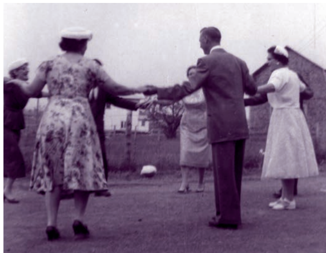
Parmi les activités de la Villa des vacances : danse au son de la radio

Les pensions de famille existaient toujours en 1955. Cette