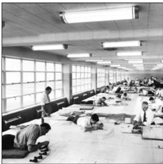
Usine de bombardiers de Ford Motor, Willow Run, Michigan, 1942.

Avec l'exposition itinérante internationale « Architecture en uniforme : projeter et construire pour la Seconde Guerre mondiale », de passage au Centre canadien d'architecture de Montréal jusqu'au 18 septembre, le commissaire Jean-Louis Cohen montre comment la guerre a accéléré les processus d'innovation et de technologie qui ont mené à la suprématie de l'architecture moderne. Cela, à travers l'étude de travaux et de réalisations d'architectes et de concepteurs, tout au long du conflit et sur toutes les lignes de front politiques. Info : 514 939-7026 ou www.cca.qc.ca