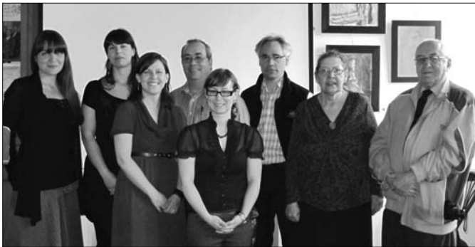
Les membres fondateurs du réseau muséal Lanaudière, ma muse