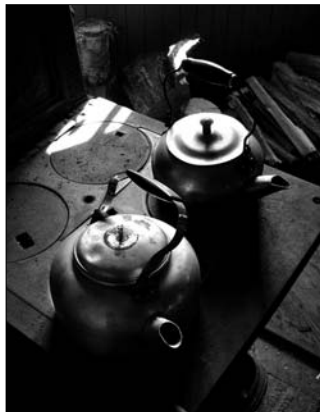
Bouilloires, parfois appelées « canards » ou « bombes »