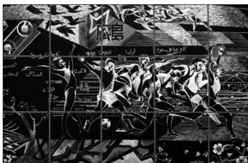
Nicolas Sollogoub, Hiroshima, les Olympiades, 1990