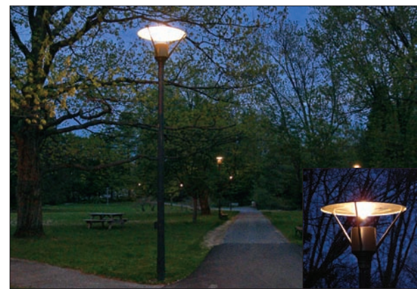
L'éclairage des sentiers du parc des Moulins, à Charlesbourg, est réussi grâce aux sources lumineuses de type indirect.

Tout est question de dosage. L'événement 400 ans chrono, qui s'est déroulé en janvier 2008 dans les principaux espaces publics du Vieux-Québec et de la colline Parlementaire, a permis d'illustrer ce principe. À cette occasion, les lampadaires Dufferin de