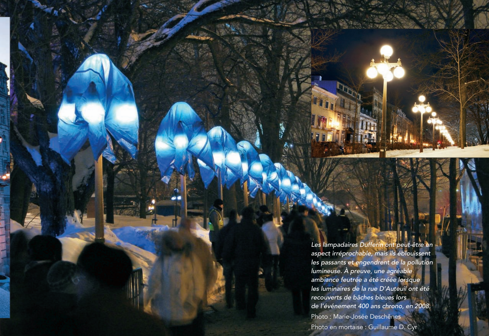
Les lampadaires Dufferin ont peut-être un aspect irréprochable, mais ils éblouissent les passants et engendrent de la pollution lumineuse. À preuve, une agréable ambiance feutrée a été créée lorsque les luminaires de la rue D'Auteuil ont été recouverts de bâches bleues lors de l'événement 400 ans chrono, en 2008.