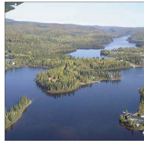
Vue aérienne du secteur de Lac-Édouard