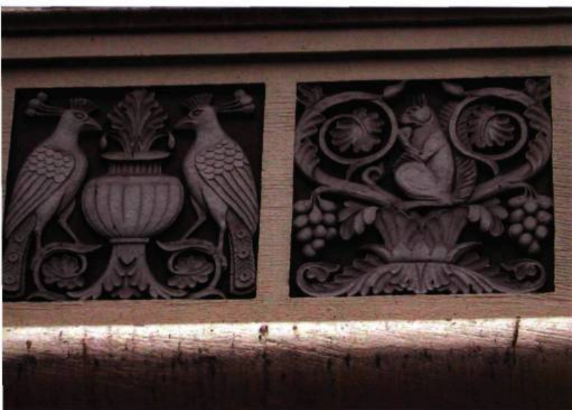
Motifs parant des bâtiments montréalais. En haut, une ornementation végétale et animale. En bas, un arrangement classique.