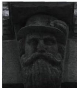
Personnages de pierre aperçus rue Saint-Pierre, à Québec.